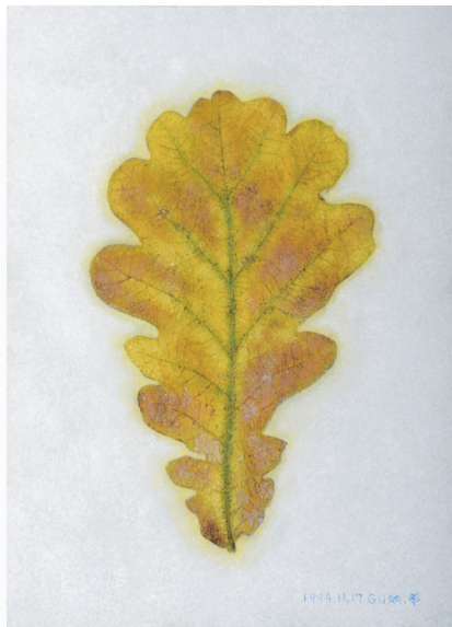
1994年11月17日 セイヨウカシワ 紙/テンペラ size:150mm×108mm