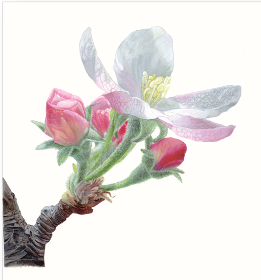
2019年5月5日 リンゴの花 紙/テンペラ size:335mm×245mm