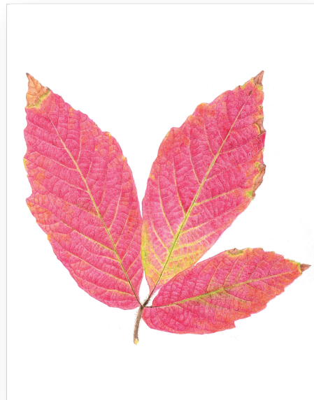
1999年1月31日 メグスリノキ 紙/テンペラ size:227mm×159mm

38年前、新緑の輝きその生命力に深く癒された経験から、葉っぱを描き始めました。原寸大で見たまま、ありのままに描く葉っぱの絵です。身の周りの葉っぱを毎日コツコツ描く私を見てみんな「修行僧の様だ」と言っていました。今回、初期の作品から近作までおよそ150点余りを展示します。どうぞ修行の成果を見に来てください。その他、「がんばろう机」に「T氏の愉快的な山登り」峠の写真館、「元気で頑張ろう」写真館もあります。なんのこともわからないかもしれませんが、来ればわかります。