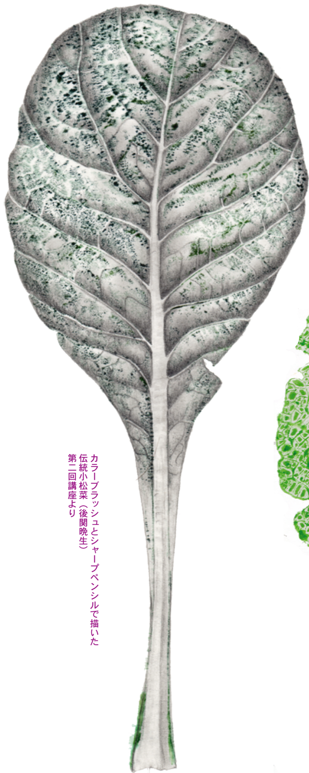
カラブラッシュとシャープペンシルで描いた 伝統小松菜（後関晩生） 第二回講座より